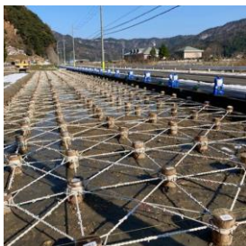
【パイルネット工法】